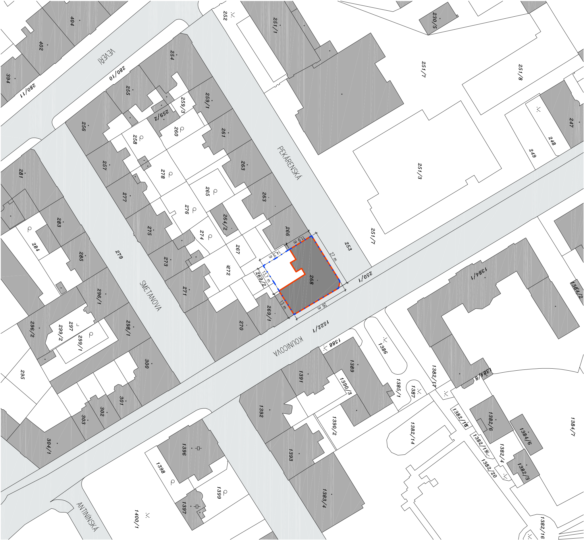
KATASTRÁLNÍ SITUAČNÍ VÝKRES, M 1:1000

CHRÁNĚNO AUTORSKÝM ZÁKONEM – zákon č.121/2000 Sb. –